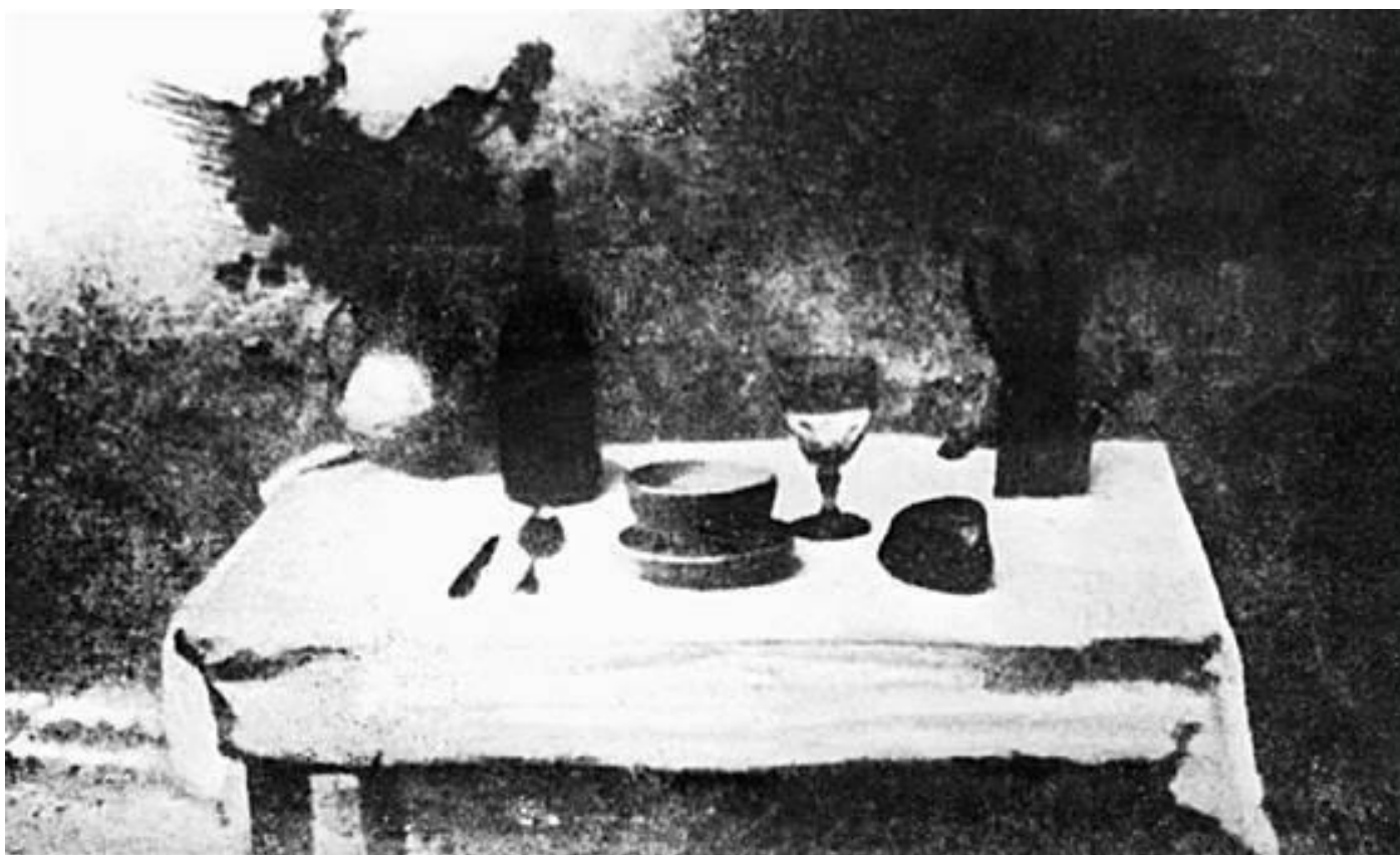
Nuotrauka: Joseph Nicéphore Niépce 1832 m.

Užduotyje išsamiai pristatoma vienas veiklos modelis ir aprašomas kitas, kurį mokytojai galės įgyvendinti vadovaudamiesi siūlomu modeliu.