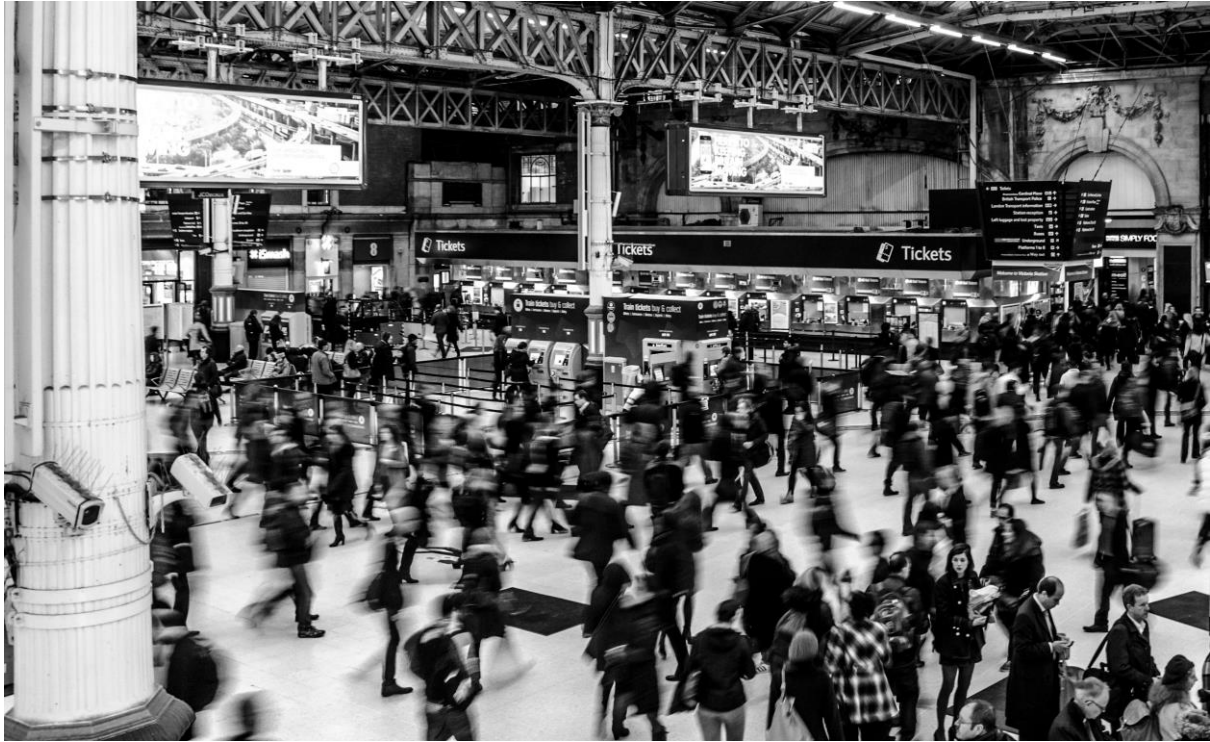
Bildtexter: Människor som går i en järnvägsstation